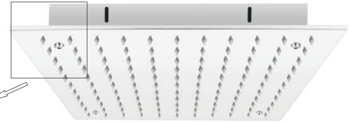
4 STAFFE IN DOTAZIONE